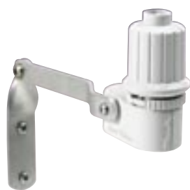
RSD-BEx čidlo srážek

Velký LCD displej s čitelnými a snadno srozumitelnými programovacími ikonami