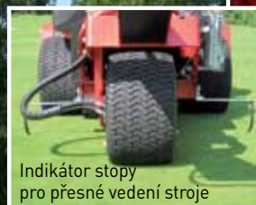
Indikátor stopy pro přesné vedení stroje