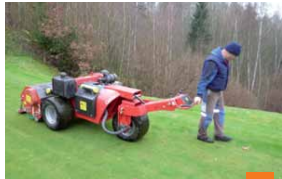
Operátor ocení snadnou ovladatelnost.