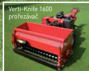
Verti-Knife 1600 prořezávač

Carrier je jedinečný multifunkční nosič určený na regeneraci golfových hřišť. Díky širokým pneumatikám a vyvážené konstrukci je tlak na půdu minimální, je vhodný i na měkké a mladé greeny. Také na traktorem těžko přístupná místa se Carrier dostane snadno. Stroj je samojízdný, pro operátora je snadno a intuitivně ovladatelný. Jedinečnost stroje tkví v možnosti připojit vícero regeneračních nástrojů, jako jsou aerifikátor, vertikutátor, sečka/dosevačka, kartáč, Verti-Knife diskový prořezávač, kartáčová pískovačka Rink 1010, atd. Záběr 130 cm zajistí kopírování i zvlněných povrchů a dostupnost i do hůře přístupných míst.