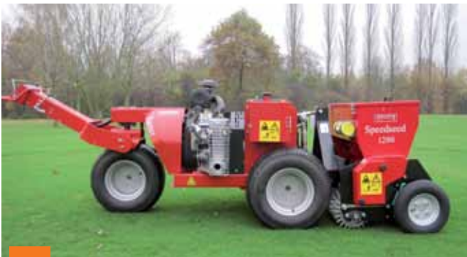
Hrotová dosévačka Speed-Seed

Carrier díky širokým pneumatikám a vyvážené konstrukci vyvíjí na půdu minimální tlak.