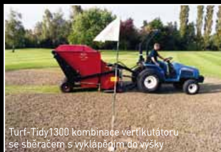
Turf-Tidy1300 kombinace vertikutátoru se sběračem s vyklápěním do výšky