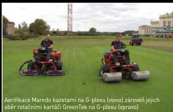
Aerifikace Maredo kazetami na G-plexu (vlevo) zároveň jejich sběr rotačními kartáči GreenTek na G-plexu (vpravo)