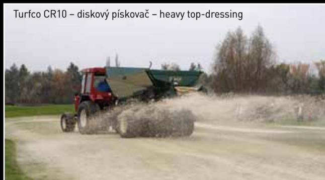
Turfco CR10 – diskový pískovač – heavy top-dressing