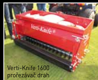
Verti-Knife 1600 prořezávač drah