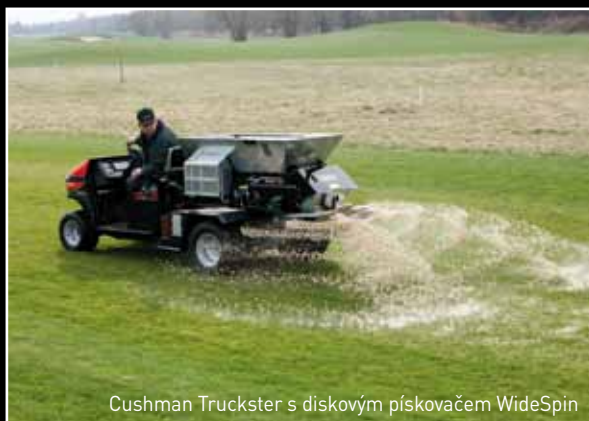
Cushman Truckster s diskovým pískovačem WideSpin