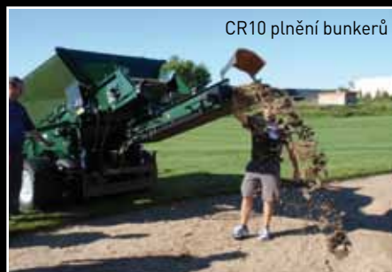
CR10 plnění bunkerů