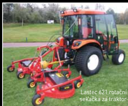
Lastec 621 rotační sekačka za traktor