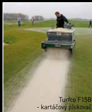
Turfco F15B - kartáčový pískovač