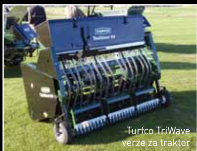
Turfco TriWave verze za traktor