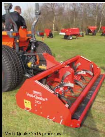
Verti-Quake 2516 prořezávač