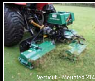
Verticut - Mounted 214