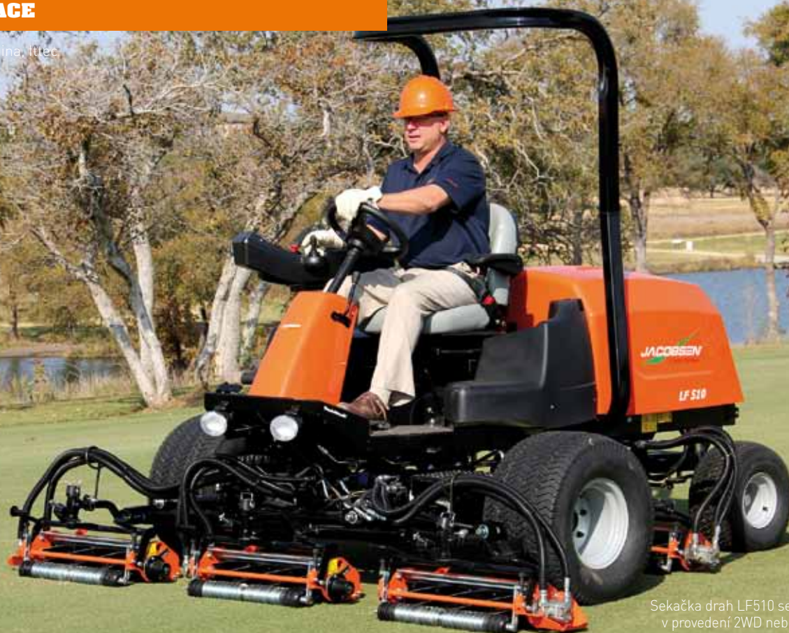
Sekačka drah LF510 se vyrábí v provedení 2WD nebo 4WD.