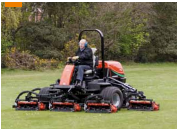
F405 největší sekačka drah se záběrem 405 cm