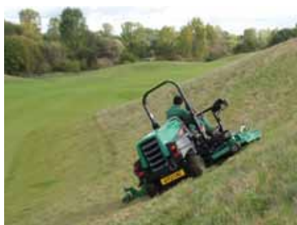
HR-6010 na golfu v Beřovicích