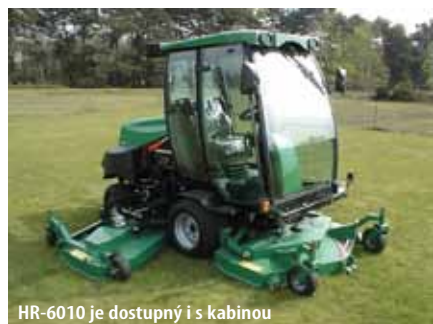
HR-6010 je dostupný i s kabinou

NOVÁ HR-6010™ je vysoce výkonná rotační sekačka s mimořádnou produktivitou. Zároveň díky sklopným postranním žací jednotkám do vertikální polohy umožňuje sečení i v úzkých prostorech.