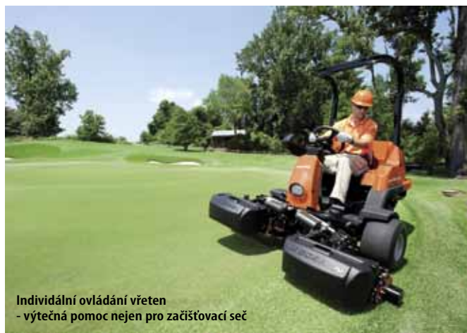
Individuální ovládání vřeten - výtečná pomoc nejen pro začišovací seč

Vysoká kvalita seče a přesné nastavení celé záčích jednotky vydrží díky přesné cylindricitě delší čas než u běžných vřeten.