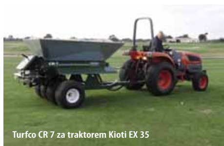
Turfco CR 7 za traktorem Kioti EX 35

Pouze pískovače Turfco rozhazují materiál jen do úrovně zadních kol. Tím nedochází k překrývání vrstev po stranách pískovače. Díky tomu s nižší spotřebou materiálu zapískujete stejnou plochu naprosto rovnoměrnou vrstvou. Šetříte peníze na pořízení písku, a zároveň se vyhnete problémům s nerovnoměrnou vrstvou písku, které se projeví v budoucnu.