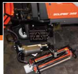
Vyklápěcí střední vřeteno

Podle nezávislých studií je díky použité technologii výrazně nižší spotřeba PHM i náročnost servisu. U dieselového hybridního modelu dochází k celkové úspoře provozních