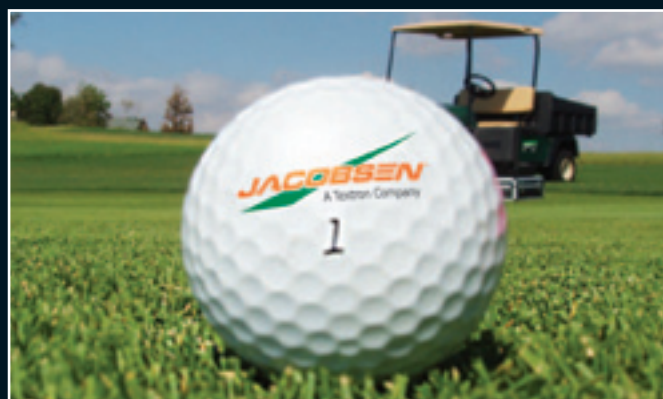
Trávník je při pravidelném používání Turf Groomingu hustší, pevnější, což zlepšuje odraz míčku, jeho odvalování i jeho rychlost.

Třiletá univerzitní studie vlivu Turf Groomingu na dosévání prokázala pozitivní zlepšení zdravotního stavu, delší udržení zelené barvy porostu na podzim, lepší přetrvání porostu přes zimu a rychlejší znovuoživení zelené barvy na jaře. Navíc se snížila potřeba dosévat, protože pravidelně prováděný Turf Grooming zajistil vyšší hustotu porostu a zdravější drn. ■