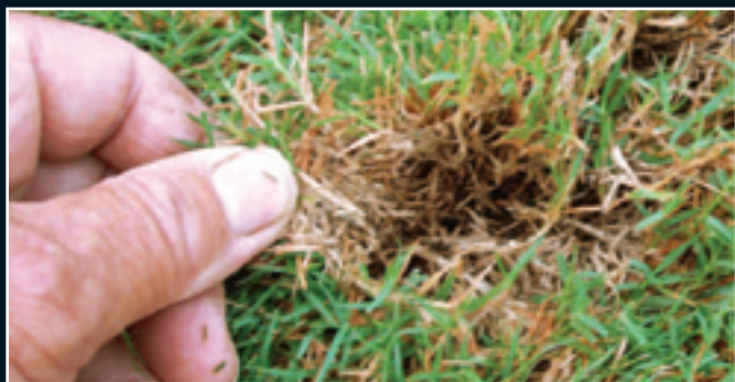
Postupná tvorba plsti