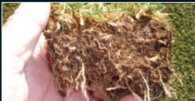
Plst' redukuje tvorbu nových kořenů

travní drn a lepší hrací vlastnosti travnatého povrchu. Zatímco vřetenem se spodním nožem sečou v horizontální rovině, aby odstranily vertikálně rostoucí výhonky, Turf Groomer je navržen tak, aby do travního porostu zasáhl hlouběji než nože vřetenem a odstranil horizontálně rostoucí výhonky. Po odstranění špiček výhonků se aktivují růstové zóny v oblasti odnožovací uzliny. Je podpořen vertikální růst nově vyrůstajících výhonků, zatímco růst laterálních výhonků se minimalizuje. Otevření travního drnu díky vertikální orientaci výhonků zlepšuje průnik vody k půdě a zrychlí výpar nadbytečné vlhkosti z porostu, čímž se redukuje možnost výskytu chorob. Trávník je zdravější, odolnější a rezistentnější vůči biotickým a abiotickým vlivům.