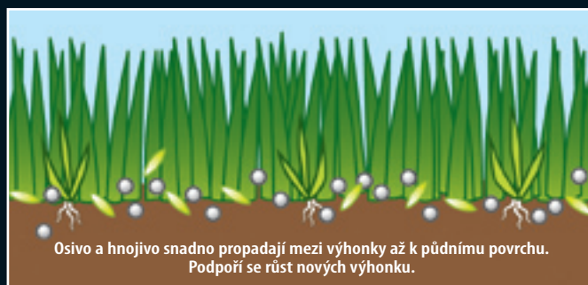
Osivo a hnojivo snadno propadají mezi výhonky až k půdnímu povrchu. Podporí se růst nových výhonků.