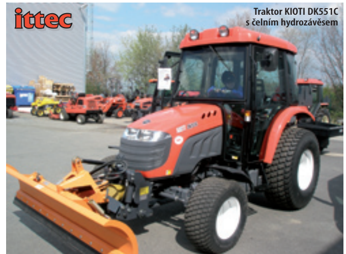
Traktor KIOTI DK551C s čelním hydrozavěsem

Možnosti informovat se, potkat staré známé, nebo i uzavřít výhodné obchody využila během třetího dubnového úterý a středy přibližně stovka lidí.