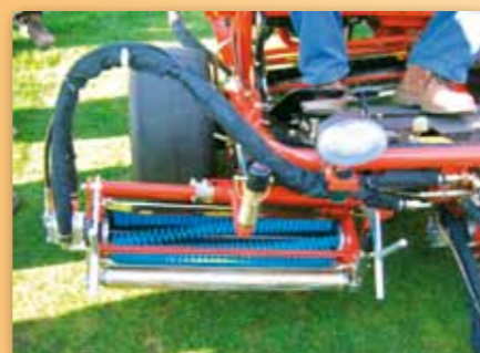
Rotační kartáče Greentek na třívetvenové sekačce