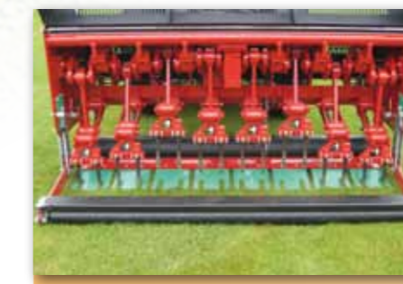
VD2220 se záštitou proti vytržení trávníku