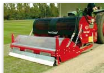
VD 7516 s rotačním kartáčem

K dostání jsou i speciální přídavná kola pro modely těžké série VD. Díky nim je k tahu možné použít i traktory o menším výkonu. Zároveň slouží k převozu Verti-Drainu na větší vzdálenosti.