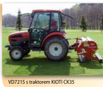
VD7215 s traktorem KIOTI CK35