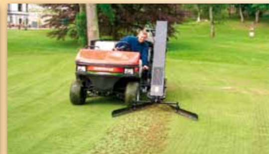
Cushman Core Harvester – nástava na pracovní vozík Cushman Truckster