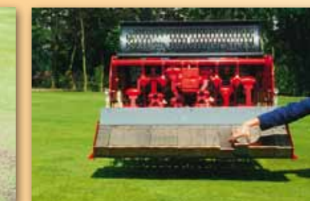
Sběrač špuntů používá dvoufázový sběrný systém. V první fázi je většina špuntů sesbírána gumovou lištou. Za ní se těsně při zemi nachází řada hliníkových zubů, které odstraní veškeré zbylé organické zbytky, aniž by hrozilo poškození trávníku.