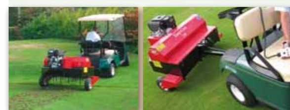
Easy-Core 116 je tažený aerifikátor s vlastním motorem a dálkovým ovladačem, který může být připojen za golfový vozík nebo sekačku.