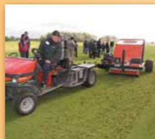
Smitho sběrač za Cushman Truckster