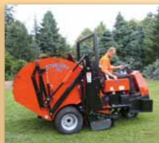
Smithco sběrače samojízdné