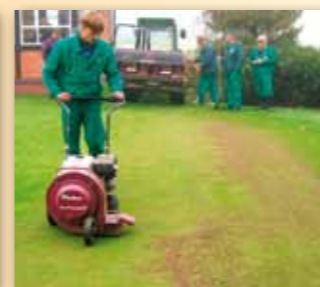
Fukary Parker Hurricane