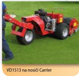
VD1513 na nosiči Carrier