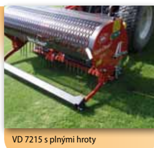
VD 7215 s plnými hroty

Série 72 a 73 reprezentuje technologie druhé generace Verti-Drainů. Nejlepší volba pro špičkovou kvalitu travníků golfových hřišť a jiných sportovních ploch. Mezi nejoblíbenější Verti-Drainy patří model 7215.