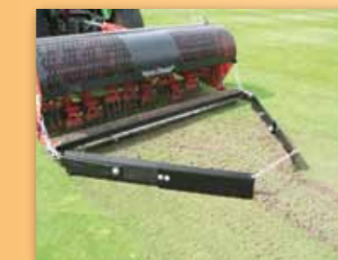
Shrnovač špuntů, díky němuž jsou vypíchané špuntů soustředěny do pruhů o šíři 1/3 záběru VD, usnadňuje jejich další odklizení.