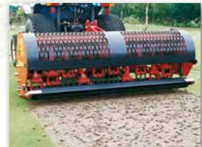
VD7117 s dutými hroty

Série 71 je nejléčí a nejrychlejší z Verti-Drainů, modely této řady jsou schopny vyvinout rychlost až 4,5 km/h při vzdálenosti vpichů 125 mm.