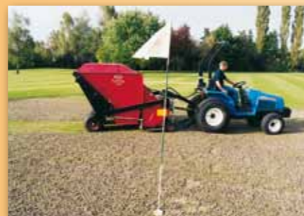
Turf-Tidy – sběrač špuntu