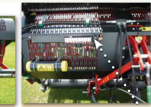
Pracovní hloubka se nastavuje hydraulicky ze sedadla traktoru, odkud na měřítko vidíte.