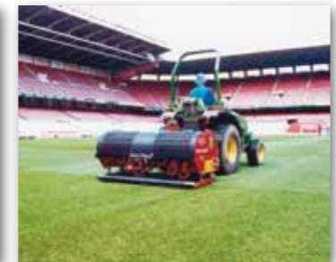
VD7113 Mustang je oblíbeným modelem pro fotbalové stadiony