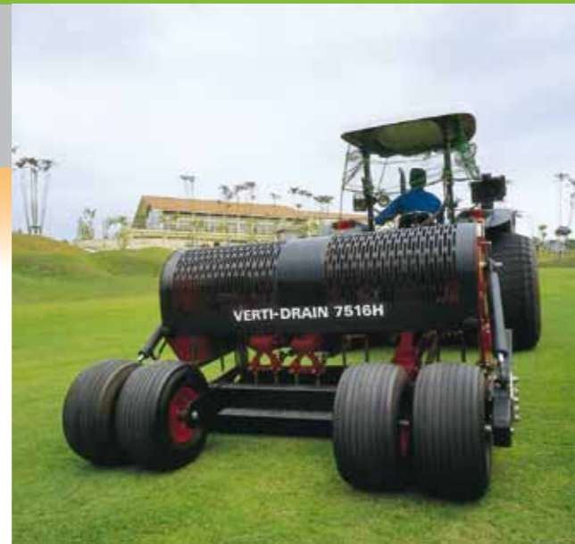
VD 7516 s přídavnými koly.