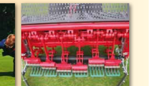
Záštita proti vytržení trávníku zajišťuje, že při slabém kořenovém systému nedochází k vytažování trávních rostlin, a tím k poničení trávníku.